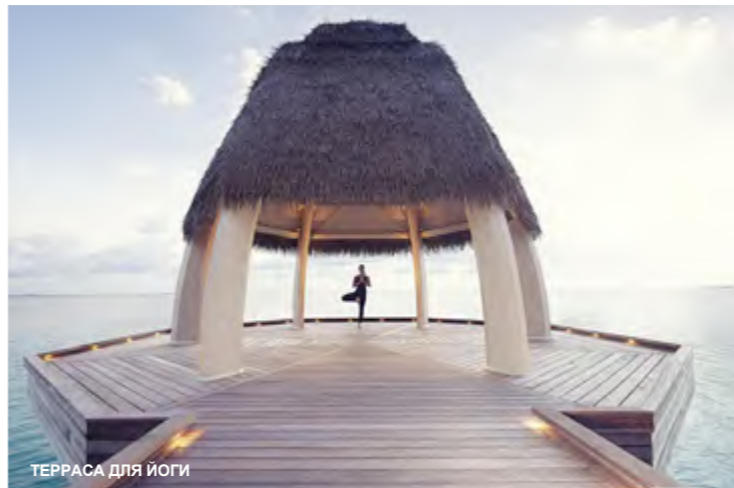
ТЕРРАСА ДЛЯ ЙОГИ