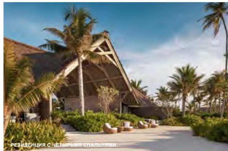
РЕЗИДЕНЦИЯ С ЧЕТЫРЬМЯ СПАЛЬНЯМИ