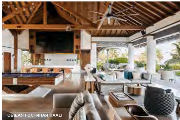
ОБЩАЯ ГОСТИНАЯ НААЛИ