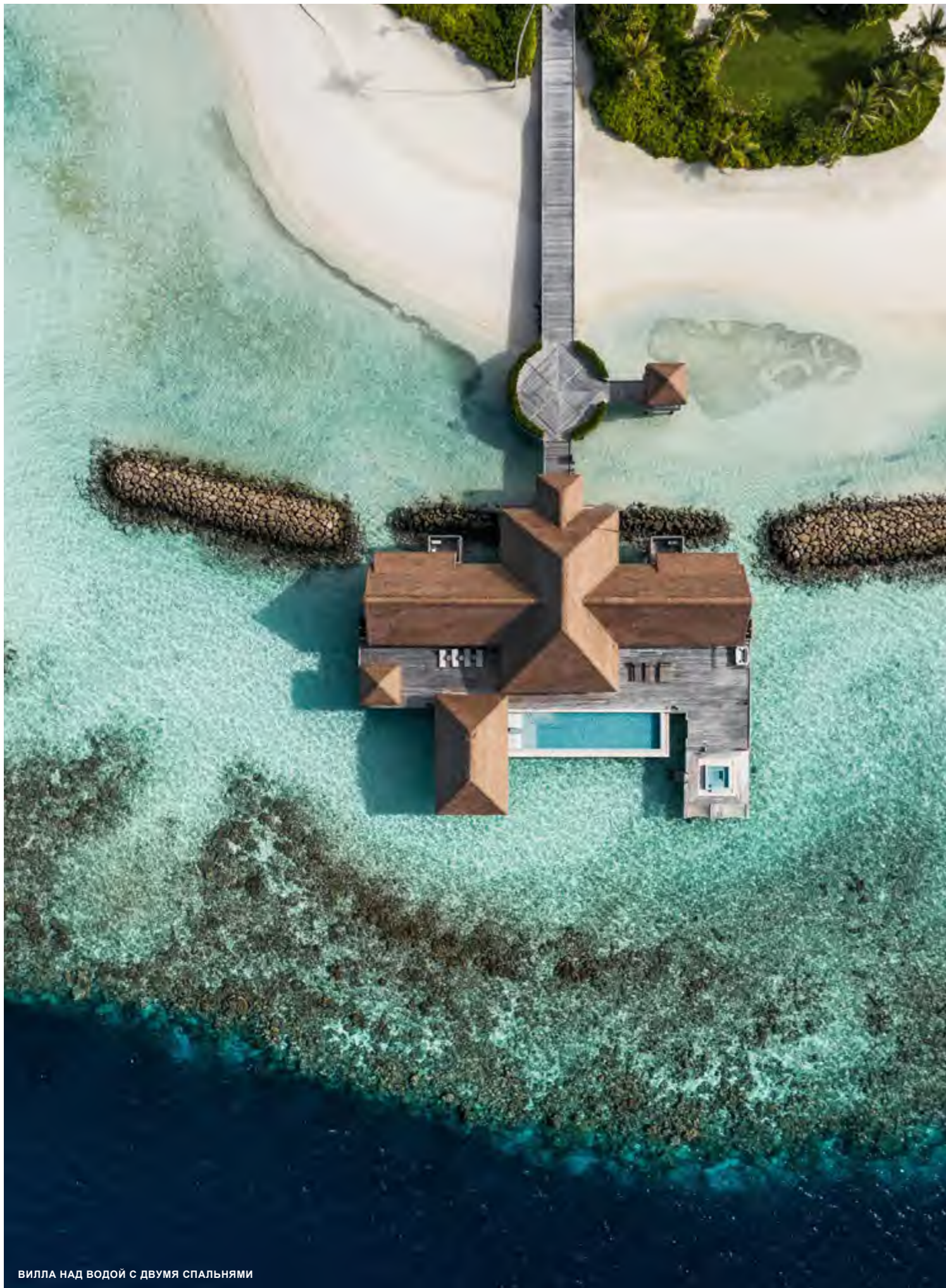
ВИЛЛА НАД ВОДОЙ С ДВУМЯ СПАЛЬНЯМИ